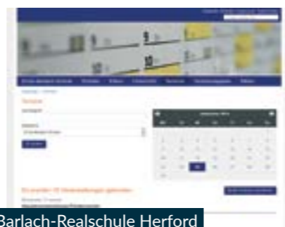
Ernst-Barlach-Realschule Herford www.ebs.herford.de